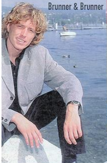
Brunner & Brunner