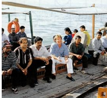
Gastfreundliche Menschen, exotische Düfte, viel Sonne. Patrick Lindner (o.) und Wencke Myhre (r.) fühlen sich wohl.

Karel Gott, «Die Stimme aus Prag», über den Dächern Dubais.