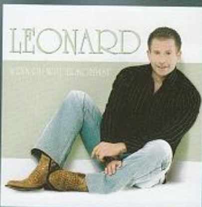
Leonard - Wenn Du wiederkommst (Album) Koch Universal - Bestell.Nr. 0677982