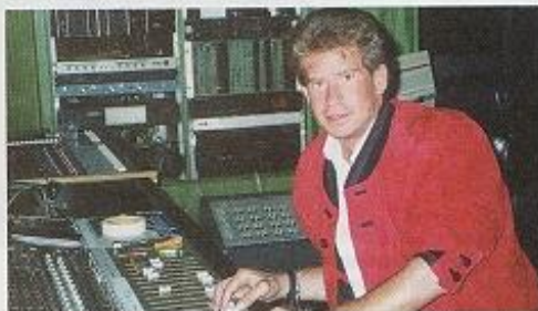
1985 produzierte Leonard die erste Single, «Einfach davon träumen». Der Traum vom Erfolg erfüllte sich erst später.

Ich weiss nicht, ob ich mit 61 Jahren noch auf der Bühne stehen möchte. Das Business wird von Jahr zu Jahr schwieriger und härter. Ich selber bin glücklich, dass ich musikalisch fast nie Kompromisse eingehen musste. Ich wollte fürs Publikum und für mich immer das Beste. ●