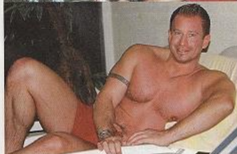
Im Jahre 2005 zeigt sich der beliebte Sänger, der regelmässig ins Fitnesscenter geht, mit durchtrainiertem Körper.