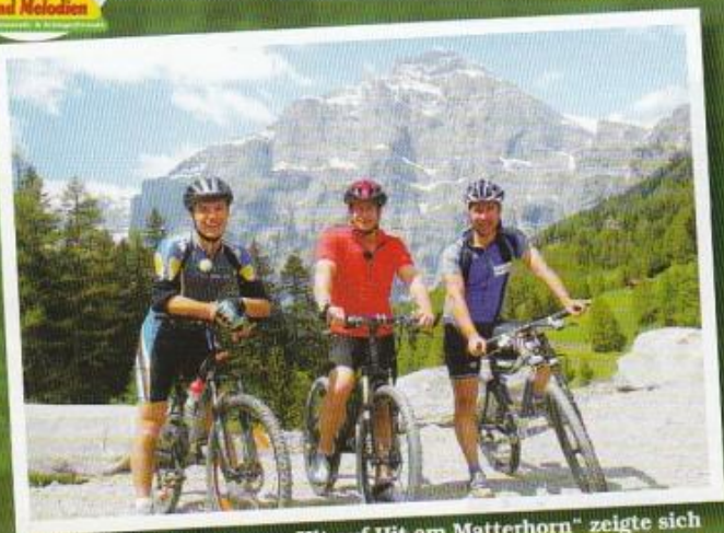
Bei der MDR-Sendung „Hit auf Hit am Matterhorn“ zeigte sich Leonard kürzlich mit seinen Trainern beim Mountainbiken

Der Sänger ist gerne auch ein Genießer: Zum Mittagessen trinkt Leonard gerne mal ein kühles Bier