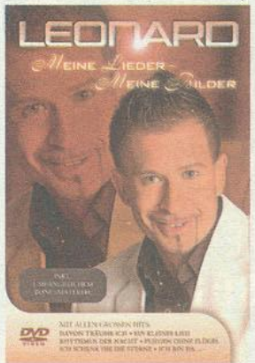
Leonard hat auch eine aktuelle DVD am Markt